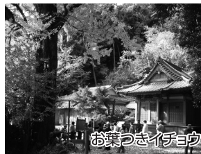
お葉つきイチョウ

【お葉つきイチョウ】 通常実ることのない葉から銀杏が実るといって大変貴重なイチョウの木で、兵庫県天然記念物にも指定されています。