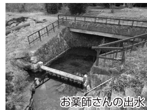
お薬師さんの出水

昔えらいお坊さんがこの村に来て薬師堂を建てた際に、薬師如来にお祈りする清水がなく困り果ててお薬師さんにお祈りして授かったのがこの出水だそうです。どんなに日照りが続いて鶉野の池が干上がり万願寺川が枯れても、この出水が枯れたことはないそうです。