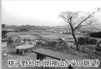
桃子野台地(明神山からの眺望)

玉丘史跡公園をスタートし左折。すぐに右折し町内の道に入る。しばらく道なりに歩き玉野南の交差点へ向かう。横断歩道を横断し北東方向の道へ歩く。天満神社の脇を左折し、突き当たりを右折後すぐに左折。横断歩道がないので車に注意しよう。すぐに細い道を右折し、しばらく道なりに歩く。万願寺川を渡り次の交差点を右折。この交差点付近の高台が桃子野台地で頂上付近に円墳があるが、現在は竹藪に覆われ沿道からは見えない。しばらく道なりに歩き、県道371号線と合流したら左折。別府西の信号を右折し奥へ進むと明神山古墳と稲荷大明神に到着。折り返し、県道371号線を右折し左側の歩道を歩く。山枝の信号を左折し、しばらく道なりに歩く。田んぼの間の道を進むと右手に玉野石仏がある。2車線の車道と合流したら横断歩道を横断し右折。少し歩くと左手に祇園神社がある。玉野南の信号を直進し、ゴールの玉丘史跡公園へ到着。