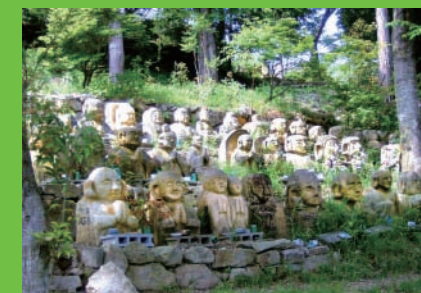
石彫の森にはアトリエ館の手彫り 体験で完成した石仏が並びます