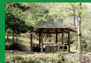
園内には、憩いの場が多数 設置されています