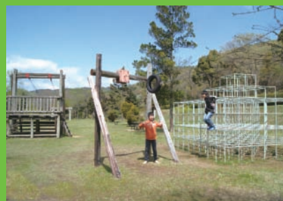
子供達を楽しめる遊具広場