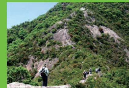
人気のハイキングコース。シーズン には多くのハイカーで賑わいます