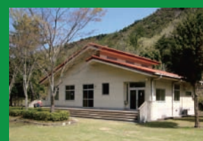
古法華自然公園管理棟