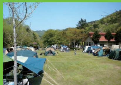
管理棟前にあるキャンプ場は 芝生のフリーサイト(事前申請必要)