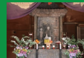
国指定文化財の石造浮彫 如来及両脇侍像(拝観予約要)