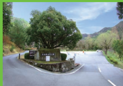
自然そのままの地形を利用した 広大な公園。西入口と駐車場付近