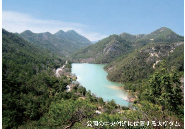
公園の中央付近に位置する大柳ダム