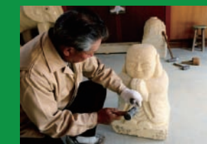
アトリエ館内での石彫風景