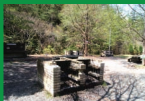
バーベキュー(BBQ) サイト