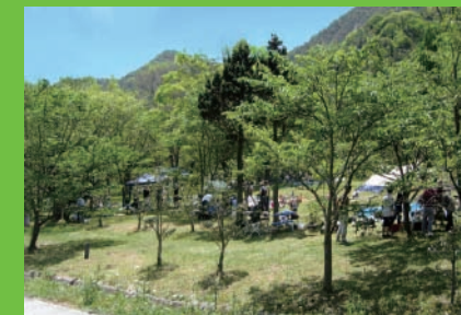
園内の広場で森林浴を楽しむ人々