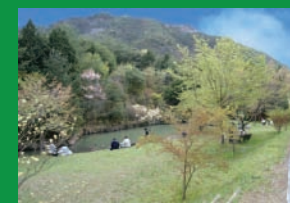
石彫の池周辺で来園者が くつろいでいる風景