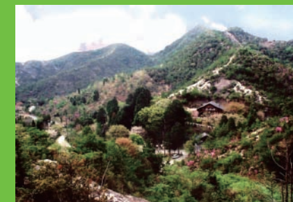
ハイキングコースから眺めた石彫 アトリエ館付近