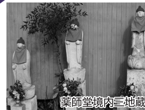
薬師堂境内三地蔵