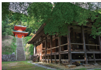
初秋の奥山寺 岡本 久