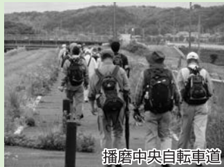
播磨中央自転車道

網引駅をスタート。踏切を渡り右折し踏切切いの自転車道を歩く。川を越えたら右折し再度踏切を渡る。川沿いに自転車道を北へ。桜並木と田園風景を楽しみながら歩こう。加西中野の交差点付近を越えたら左折し川を渡る。国道372号線との交差点付近に自転車道の案内板、前田橋阿弥陀石仏がある。車に注意して横断、川沿いの自転車道を北西へ歩く。しばらくすると自転車道が川沿いを離れ左へ曲がるので、自転車道に沿って左折し田んぼの間を歩く。この辺りは白鳥の飛来地となっている。県立フラワーセンターの東側の森沿いを歩き、国道176号線と合流したら右折。歩道を歩き玉野南の交差点を左折。しばらく道なりに歩くと左側に玉丘史跡公園がある。玉丘の交差点を左折。ここまでで自転車道歩きは終わる。しばらく車道沿いの歩道を北条町方向へ歩き、横尾第2の交差点を左折。交番がある交差点を右折したらゴールの北条町駅に到着。