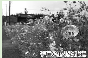
宇仁の里・花畑街道

元来た青野運動公園の道の方へ横断し、南へ歩く。370号線に出たら右折し中国自動車道の高速バス泉バス停の看板を左折したらゴール。