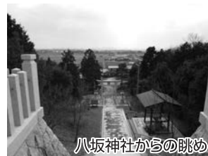
八坂神社からの眺め