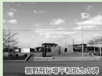
鶉野飛行場平和祈念の碑

法華口駅をスタートし、北条町駅方の踏切を渡ると県道716号線に出るので、車に注意して近くの横断歩道を渡ろう。横断歩道を直進し脇道に入り、すぐに右折。しばらく歩くと大きな物流センターが見えてくるので手前の交差点の細い