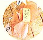
揚げおかき八千代の花 多可町