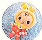
もとずきんちゃん人形 元町商店街