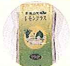
お風呂用レモングラス 三木市