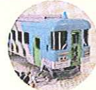
北条鉄道ストラップ 加西市