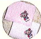
にっしーハンカチ 西脇市