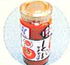
とまとケチャップ 小野市