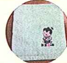
伝の助ミニタオル 加東市