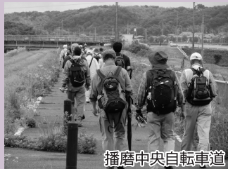
播磨中央自転車道

網引駅をスタート。踏切を渡り右折し踏切切いの自転車道を歩く。川を越えたら右折し再度踏切を渡る。川沿いに自転車道を北へ。桜並木と田園風景を楽しみながら歩こう。加西中野の交差点付近を越えたら左折し川を渡る。国道372号線との交差点付近に自転車道の案内板、前田橋阿弥陀石仏がある。車に注意して横断、川沿いの自転車道を北西へ歩く。しばらくすると自転車道が川沿いを離れ左へ曲がるので、自転車道に沿って左折し田んぼの間を歩く。この辺りは白鳥の飛来地となっている。県立フラワーセンターの東側の森沿いを歩き、国道716号線と合流したら右折。歩道を歩き玉野南の交差点を左折。しばらく道なりに歩くと左側に玉丘史跡公園がある。玉丘の交差点を左折。ここまでで自転車道歩きは終わる。しばらく車道沿いの歩道を北条町方向へ歩き、横尾第2の交差点を左折。交番がある交差点を右折したらゴールの北条町駅へ到着。