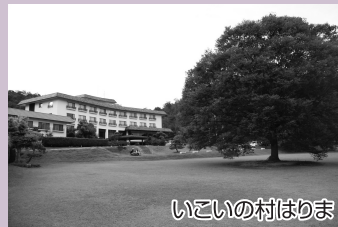
いこいの村はりま

いこいの村はりまの広場をスタートし園内の道を通って、いこいの村はりまの入口を左折。道なりに歩き公民館前を右折し、まっすぐ進もう。笹倉信号を注意して横断し、町内を道沿いにまっすぐ進むと、万願寺川沿いの道になる。橋の近くの川沿いの道には桜並木が植えられている。玉妻橋を左折し、一つ目の村道を左折。突き当たりまで来たら右折し、しばらく歩くと左手に西の垣内古墳が見えてくる。公会堂がある十字路を左折し、加西工業団地の看板が建っている交差点を右折。工業団地内の歩道を南へ歩く。突き当たりまで来たら直進し、林の中の細い道へ入る。しばらく歩くと左手に乎疑原神社、右手には加西市指定文化財の梵鐘がある。乎疑原神社を過ぎると右手に百代寺がある。脇に赤い燈ろうが建てられた林の中の道を下り左折し、そのまま道なりに進む。民家の中を歩き、二手に分かれている道を右折し直進。左折すると県指定文化財「山の脇瓦窯跡」があるのでぜひ見てみよう。突き当たりを右折し、村道を道なりに歩こう。県道371号線と合流したら左折し直進する。アラジンスタジアム手前を右折し、池に沿って歩きゴールのいこいの村はりまへ到着。