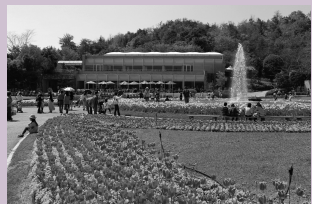
ハナナなど、季節毎に花壇に植えられる草花の数は年間60万株に及びます。

自然の松林に囲まれた園内は中央に満々と水をたたえた亀ノ倉池、南国ムードあふれる大温室や大小様々な花壇や樹木園で構成されています。春は多品種のチューリップで埋め尽くされ、夏はサルビア、マリーゴールド、秋はキク、冬はビオラやハナナなど、季節毎に花壇に植えられる草花の数は年間60万株に及びます。 (住所：加西市豊倉町飯森1282-1)