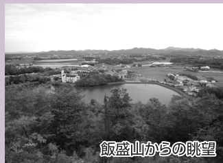
飯盛山からの眺望

播磨横田駅から北条町駅方向へ線路沿いを歩き、最初の信号のない交差点を右折し踏切を渡る。道なりに歩き、Y字の分岐を左へ。坂を少し登るとすぐにまた分岐があるので左へ進むと、左手にため池が見えてくるので、池沿いに歩く。道なりに進むと、県道43号線と合流するので、車に気を付けて横断しよう。工場沿いをしばらく歩き、県道23号線と合流したら、横断せずに右折。左手に見える農業高校の牧場や、高校の校舎を眺めながら真っ直ぐ歩くと大きな交差点がある。車に注意して横断し、そのまま真っ直ぐ進むとフラワーセンターの南入り口に到着。園内から飯盛山に登ることができ、頂上には展望小屋が整備されている。帰りは高校前の信号を過ぎた後の脇道に入り、道なりに歩く。左手に大きな池がある十字路を右折する。血池橋を渡り左折し、しばらく歩くと橋が見えてくるので、渡る前に右折し、県道43号線を横断する。見通しが悪いので注意しよう。大日堂の近くには潮の井がある。道なりにしばらく歩くとゴールの播磨横田駅に到着。